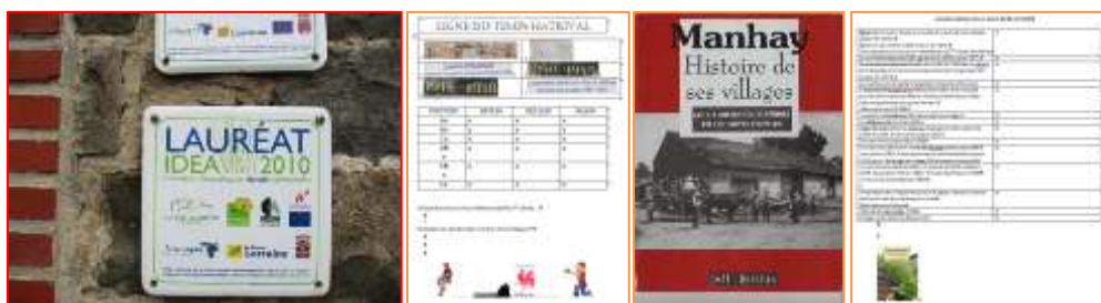
Tableau récapitulatif des animations proposées :

Avant ces animations, Roland prend contact avec les directeurs et instituteurs, rencontre le service urbanisme de la commune, le SI ou Maison du tourisme. Il se rend sur place pour prendre des photos, rencontrer des personnes ressources (président CCATM, CLDR, ...), fait des recherches cartographiques, iconographiques sur le web afin de préparer un road-book spécifique pour chaque école. Les animations sont également adaptées en fonction des classes.