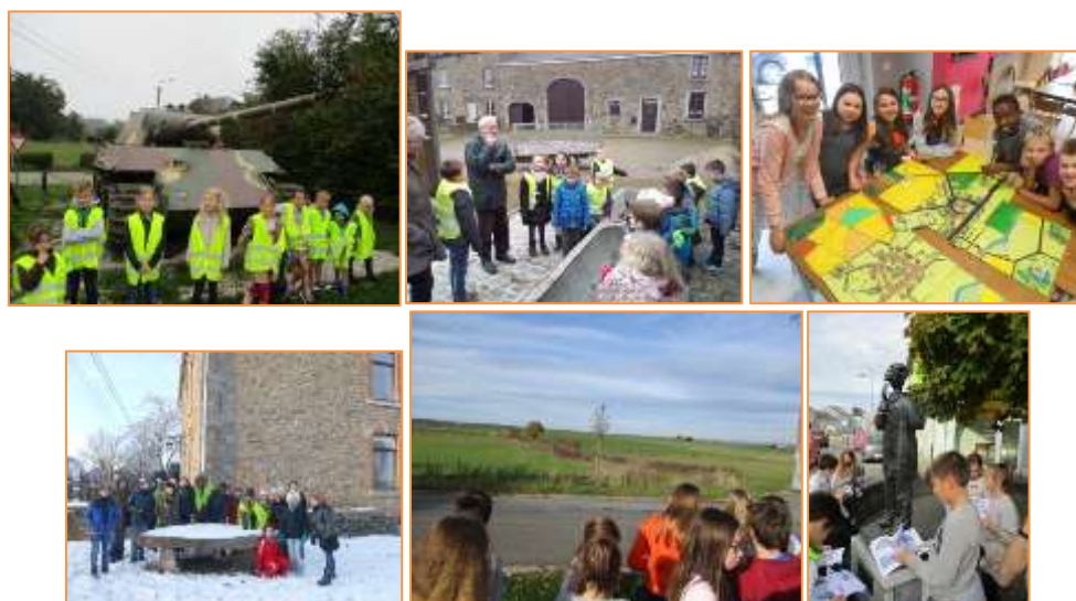
Photo devant l'emplacement du futur Quartier Nouveau